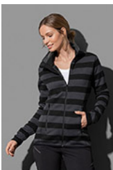
ST5190 Striped Fleece Jacket