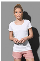
ST8700 Cotton Touch