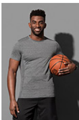
ST8850 Recycled Sports-T Race