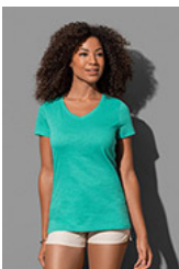
ST9510 Sharon Slub V-neck