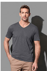
ST9410 Shawn Slub V-neck