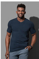
ST9610 Clive V-neck