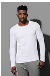
ST9620 Clive Long Sleeve